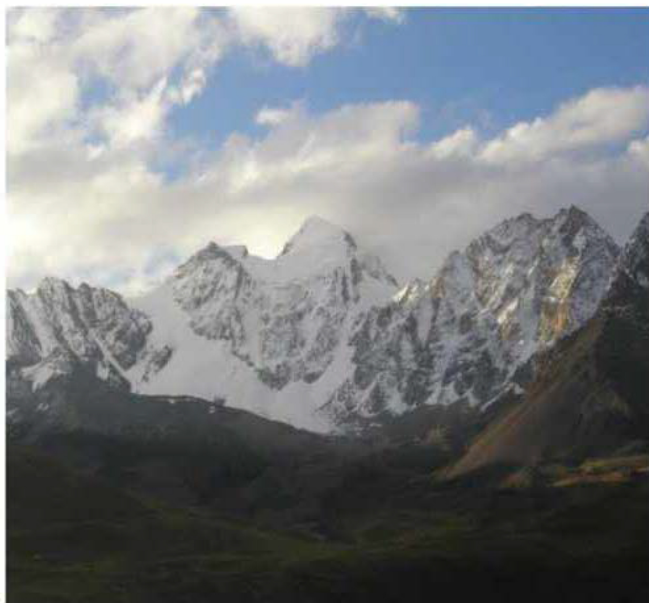
アンデスの山/ワイナ・ポトシ