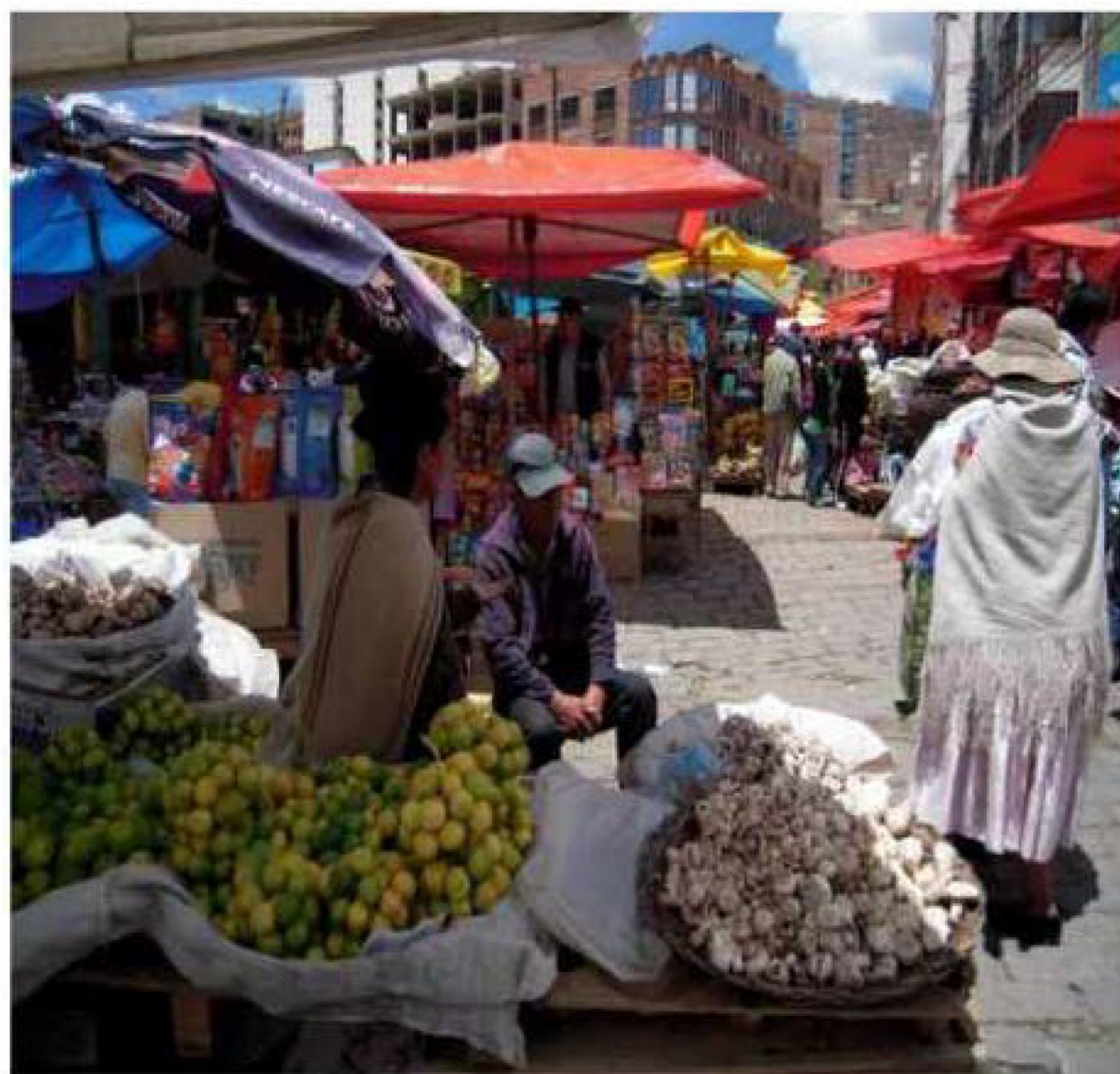
ロドリゲス市場/ラパス

1982年チャランゴの巨匠エルネスト・カブールの招きで単身ポリビアに渡る。1986年より名門「ルス・デル・アンデ」のリーダーとなる。ポリビアを代表する音楽家・作曲家としてリスペクトされている。現在は丹沢の麓に拠点をおき、全国各地、世界各国でソロコンサートを中心に活躍している。